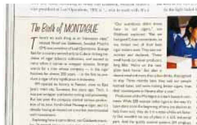
Tidningen Smoke ägnar en del av sitt vinter-nummer åt Montague.

I artikeln refererar Smoke även till ett tidigare nummer av tidningen där Montague bedömts och fått betyget 4,4 på en femgradig skala. "Om du inte hört talas om Montague än kommer du snart att göra det", skriver de.